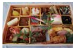
(昨年度のおせち料理)