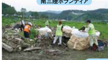
南三陸ボランティア