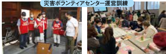
災害ボランティアセンター運営訓練