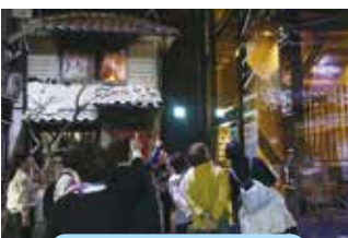
ボランティアバス研修

令和6年度1月1日に発生した「令和6年能登半島地震」により、被災された皆様に心よりお見舞い申し上げます。 田尻町社会福祉協議会でも義援金箱を設置しております。 皆様の温かいご支援をお願いいたします。