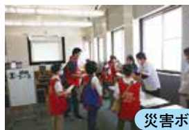
災害ボランティアセンター設置訓練