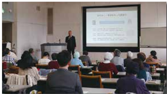
漢字教育士による講座風景12/18

また、3回目講座の一コマ「創作漢字」では、受講生の作品18点の中から受講生の投票により、以下の 優秀作品 が選ばれました。なお、全作品18点はふれ愛センターにも掲示中です!