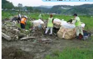
南三陸ボランティア

社会福祉協議会では、ボランティアや市民活動の推進や支援を行っています。また、災害発生時には、 災害ボランティアセンター を開設、運営する役割も担っています。そのためにも普段から啓発活動、又研修等を実施しております。